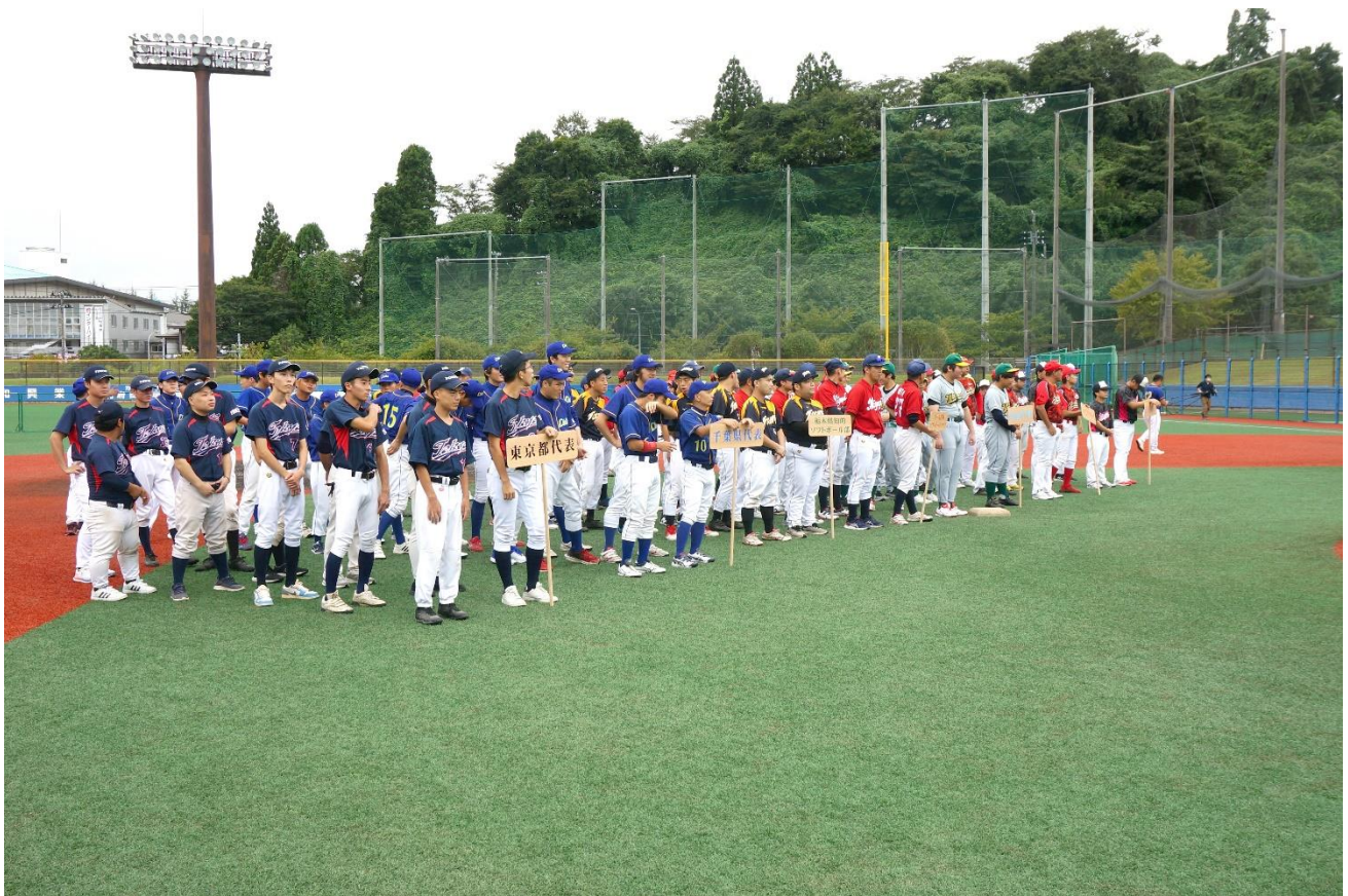
(開会式 楽天イーグルス利府球場にて)